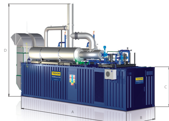
CENTO и QUANTO в контейнере